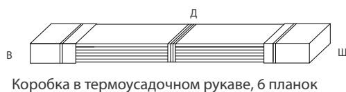
Коробка в термоусадочном рукаве, 6 планок